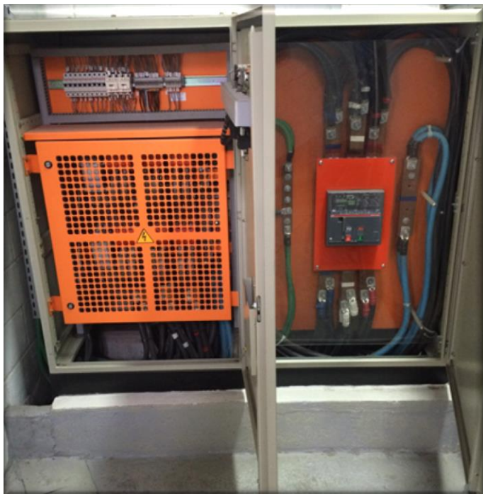
QD-GERAL / QTA 1200A

Fornecimento de mão de obra e material para montagem e instalação quadro de transferência e quadro de distribuição.