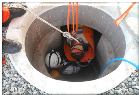
Treinamento de Segurança em Espaço Confinado – NR 33