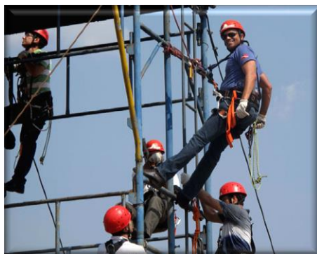
Treinamento de Segurança em Trabalho em Altura – NR 35