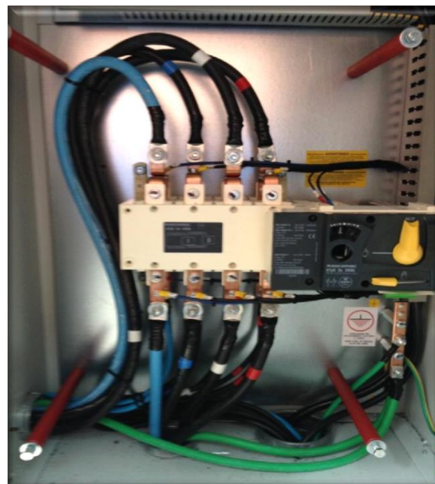
QUADRO DE TRANSFERÊNCIA 630A