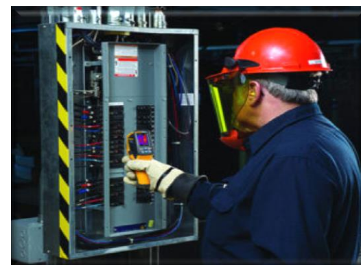
Treinamento de Segurança em Instalações e Serviços em Eletricidade – NR 10