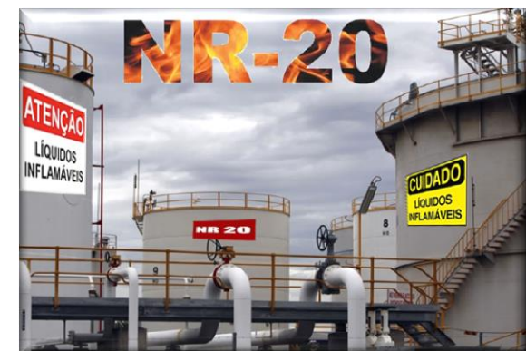
Treinamento de Segurança e Saúde no Trabalho com Inflamáveis e Combustíveis