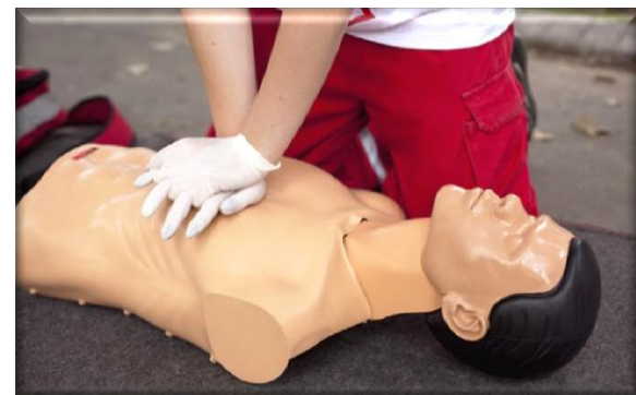
Treinamento Primeiros Socorros